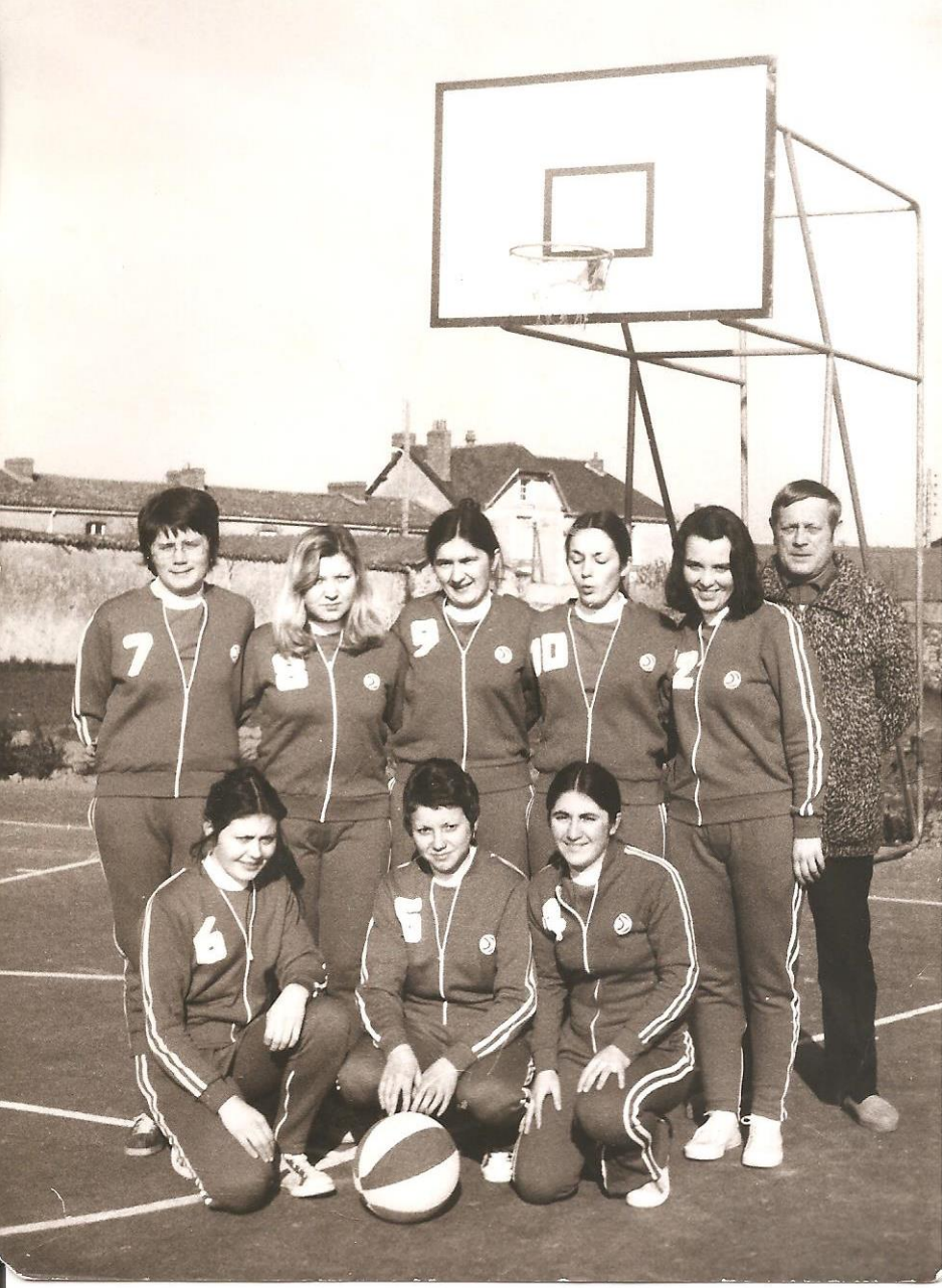
P3 seniors Filles en 1971-1972