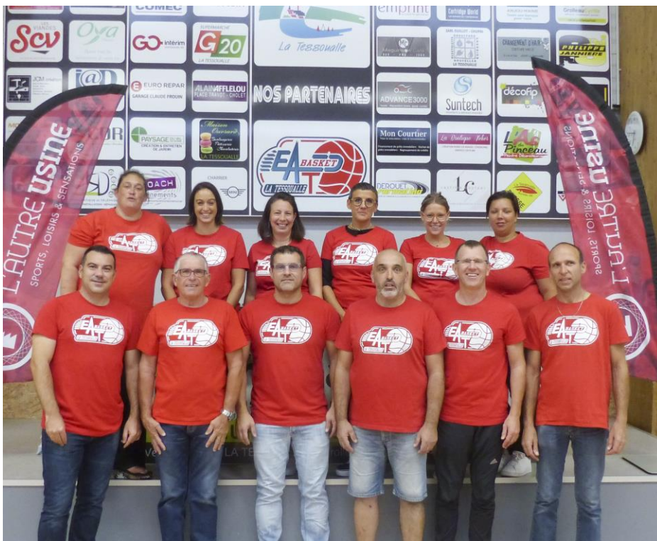
Comité directeur 2019/2020